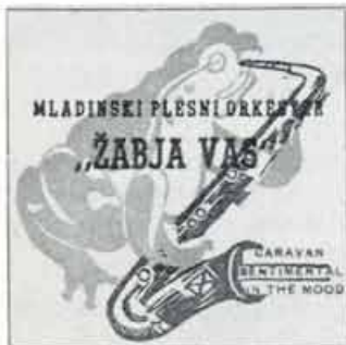
Značka iz leta 1947

V okvir jubilejnih prireditev ob 30. obletnici štejejo samostojni 30-minutni nastop orkestra v prvem programu Radia Ljubljana, RTV snemanje, sodelovanje na prireditvi »Telesna kultura v Celju 1975«, samostojni celovečerni koncert v Celju, ples za podporne člane orkestra, sodelovanje na prireditvi JLA in druge nastope.