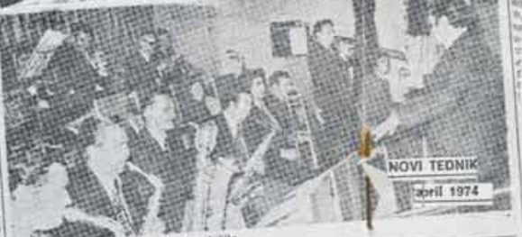
Žabe so s svojo glasbo pomorno zaslužile

Veliko je bilo prostih let, ko se je celjski plesni orkester Žabe odpravil na koncert. Orkester je bil ustanovljen leta 1946 in danes šteje 100 članov. Na koncertu so igrali skladbe iz repertoarja plesnih orkestrskih skladateljev, ki so jih skladali v celjski občini. Orkester je bil ustanovljen leta 1946 in danes šteje 100 članov. Na koncertu so igrali skladbe iz repertoarja plesnih orkestrskih skladateljev, ki so jih skladali v celjski občini.