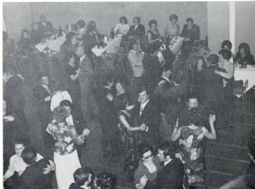
1973 — v znaku razpoloženja na žabjem plesu