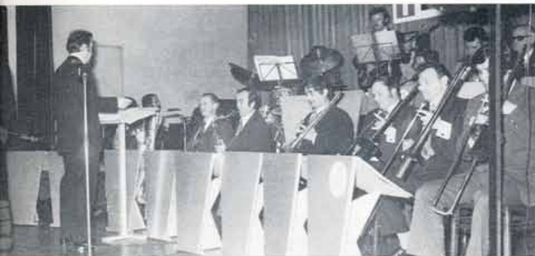
Na koncertu v Narodnem domu 1974 z gostjo Majdo Sepe