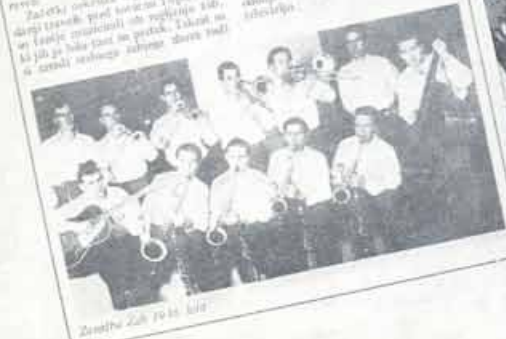
Zabavni Orkester Žabe, 1988

Orkester je bil ustanovljen leta 1958, ko so se skupaj zbrali ljubitelji glasbe, ki so se odločili, da ustanovijo orkester, ki bo praznoval 30. jubilej. Orkester je bil ustanovljen leta 1958, ko so se skupaj zbrali ljubitelji glasbe, ki so se odločili, da ustanovijo orkester, ki bo praznoval 30. jubilej.