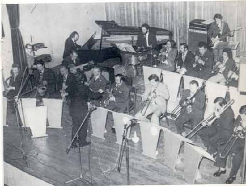
Plesni orkester Zabe na zaključnem plesu BAI 1976 v Narodnem domu